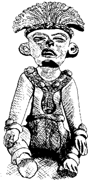
Der Mann von Cuautla

nach dem Fundort der Figur im nördlichen Mexico benannt. Der Mann sitzt flach auf dem Boden, er trägt eine Federkrone, sein Kopf ist leicht nach hinten geneigt, und er hält die Zunge zwischen den Lippen. Die Beine sind ausgestreckt die Knie leicht gekrümmt. Der linke Arm ist etwas stärker gestreckt als der rechte, die linke Hand liegt seitlich auf dem Knie, während die rechte Hand gespannt auf dem rechten Knie ruht.